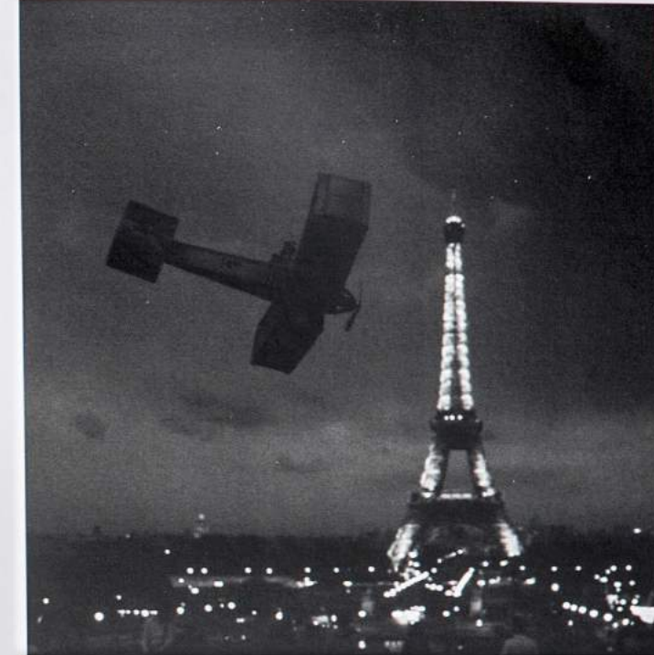
Autour de la Tour Eiffel