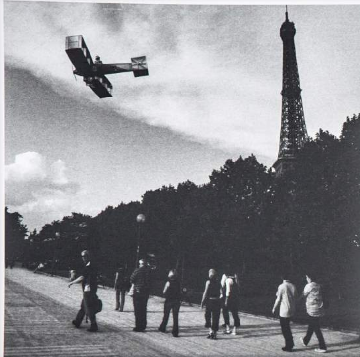
Sur le Jardin des Tuileries